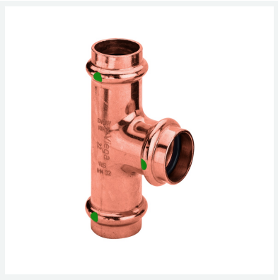
Té Profipress avec SC-Contur modèle 2418 article 315 016