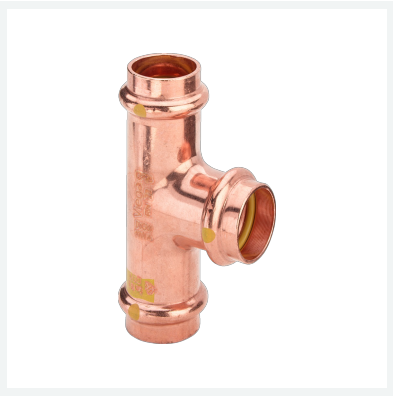
Té Profipress G avec SC-Contur modèle 2618 article 345 952