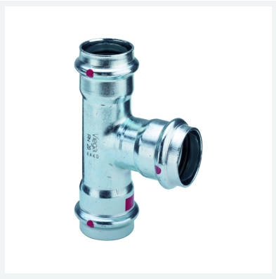
Té Prestabo avec SC-Contur modèle 1118 article 558 703