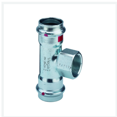
Té Prestabo modèle 1117.2 article 558 901