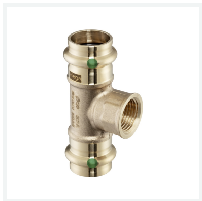
Té Sanpress modèle 2217.2 article 281 359