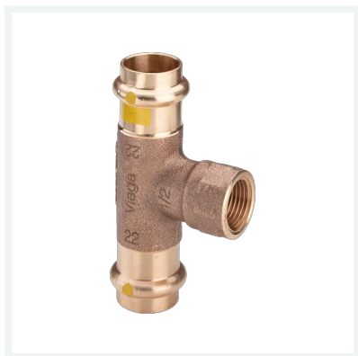
Té Profipress G modèle 2617.2 article 352 714