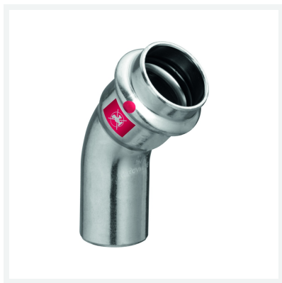
Coude 45° Prestabo modèle 1126.1 article 558 390